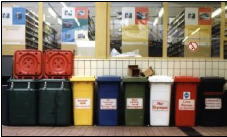
Resim 4.1: Oto tamirhanelerinde maliyeti azaltmak amacıyla yapılan ayrı toplama örneği

Bunların dışında örneğin otomobil boyama, motor ayarı yapımı ya da karoser yapımı gibi özel işlemlerden dolayı boya atıkları, soğutucu yağ ya da metal talaşları gibi ilave tehlikeli atıklar da çıkabilir.