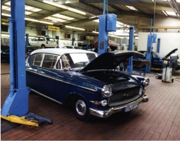
Resim 3.1: Bir oto tamirhanesinden görüntü

En iyi atıklar önlenmiş atıklardır ve atıkların birçoğu basit ve hiç ya da çok az maliyetli fakat bertaraf giderlerini azaltacak tedbirlerle önlenir. Bu yüzden bu rehber doküman önemli teknik ipuçlarının yanı sıra çabuk ve fazla emek gerektirmeden uygulanabilecek tedbirlere odaklanmıştır.