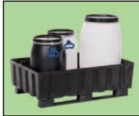
Resim 5.1: örnek taşınabilir depolama kapları