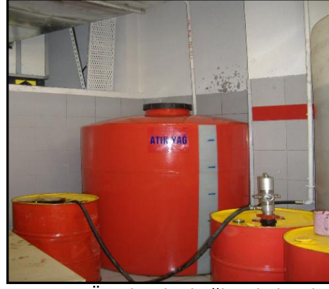
Resim 5.4: Örnek sabit bağlantılı depolama tankı